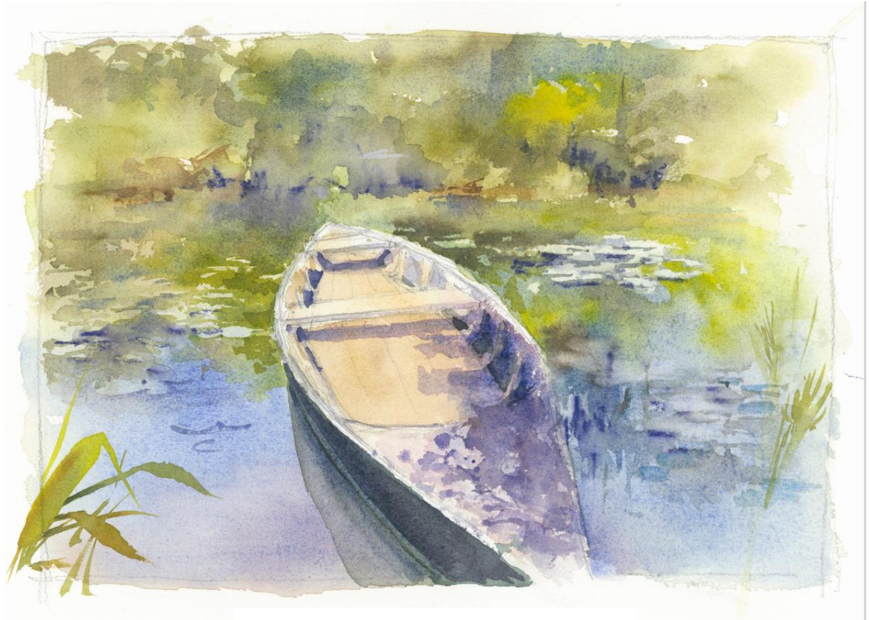
Barque aux nénuphars