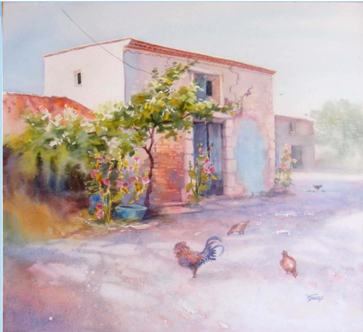
Illustration 18: Catherine Touzé©2020, tous droits réservés