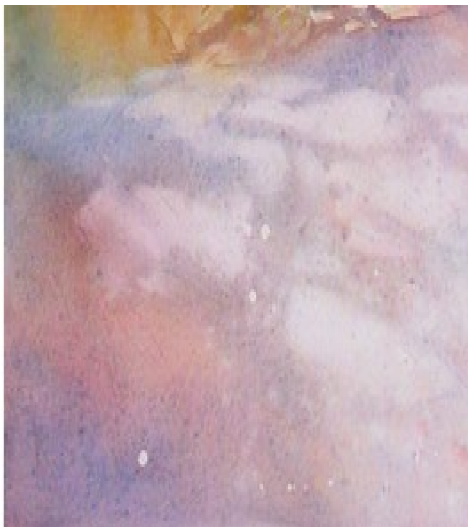
Illustration 6: Catherine Touzé©2020, tous droits réservés

*Sur fond encore humide , faire avec un peu de bleu de cobalt une ligne à la base du bâtiment, les ombres sur la porte.