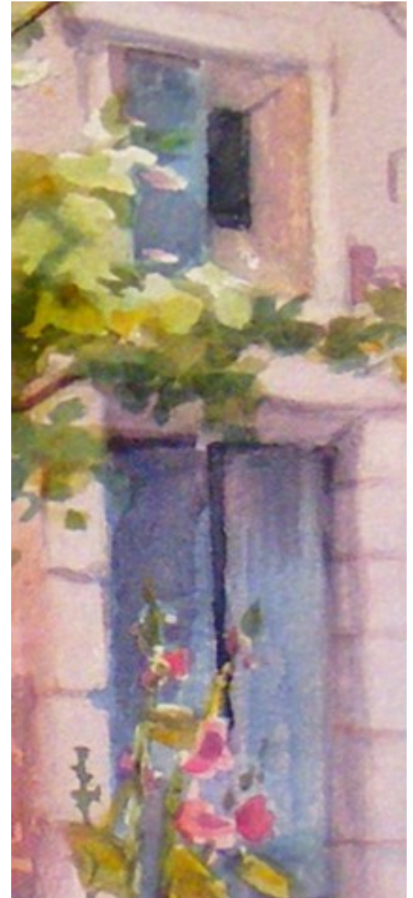
Illustration 9: Catherine Touzé©2020, tous droits réservés