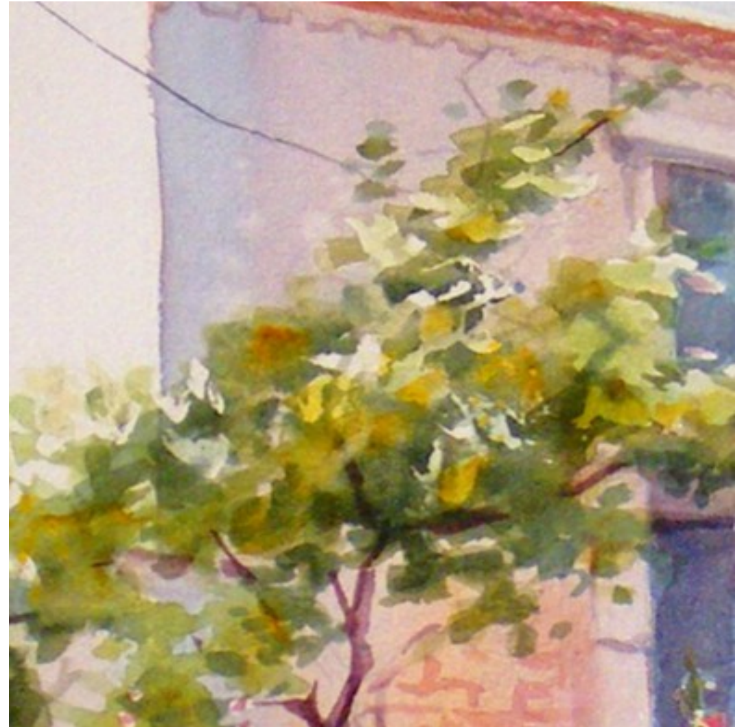
Illustration 11: Catherine Touzé©2020, tous droits réservés

* Poursuivre avec des teintes plus sombres pour rendre le volume de la vigne,( entraînez vous sur brouillon ).