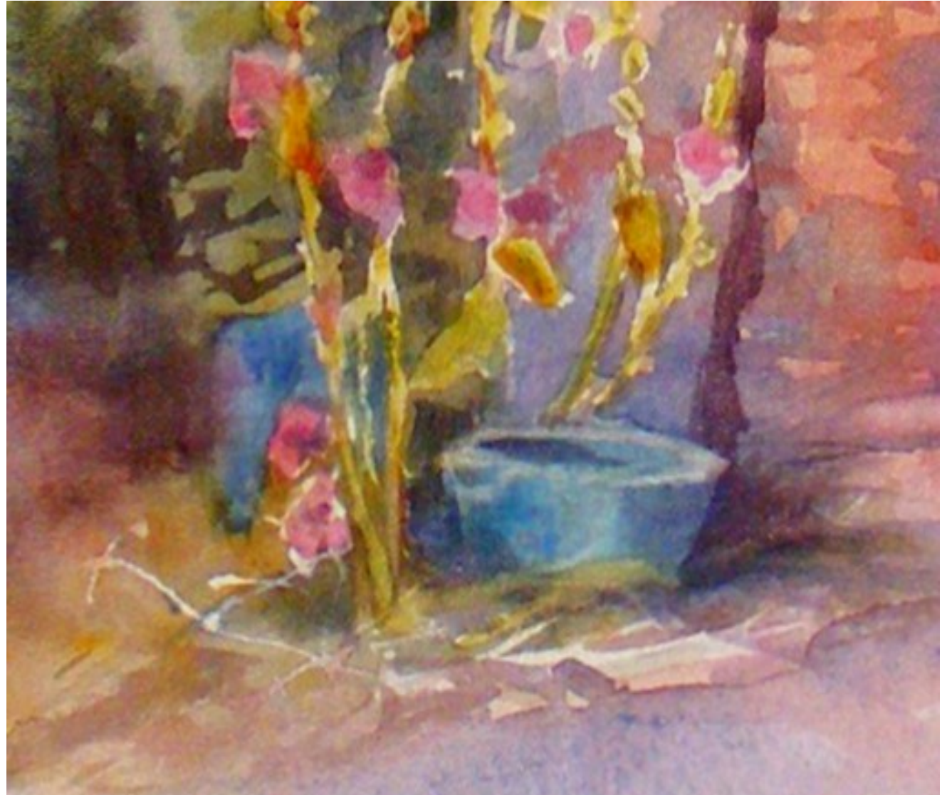
Illustration 13: Catherine Touzé©2020, tous droits réservés

* Colorer alors les roses trémières avec du rose et un peu de cobalt, et des verts clairs pour les feuilles.