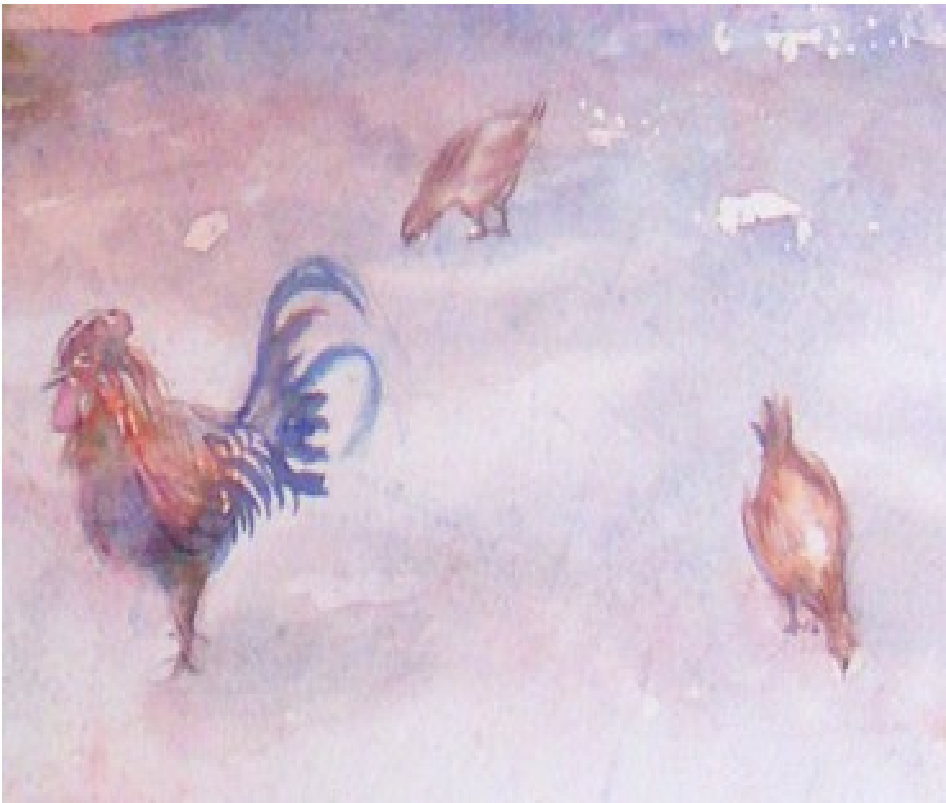
Illustration 16: Catherine Touzé©2020, tous droits réservés

*Il est important de conserver la bande de lumière séparant les deux bâtiments.