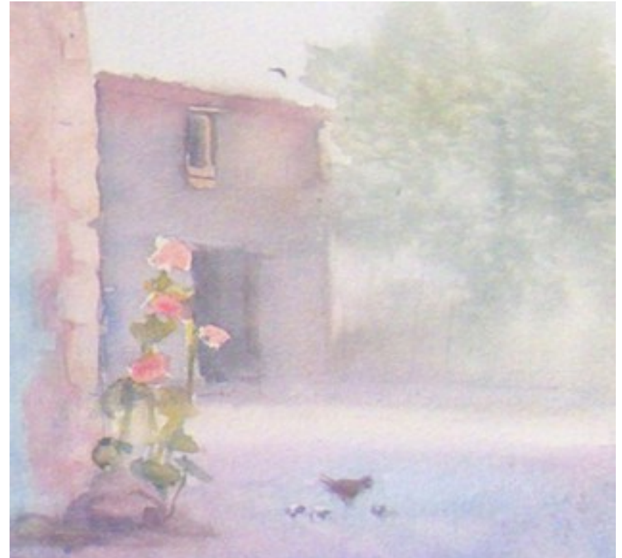
Illustration 15: Catherine Touzé©2020, tous droits réservés

*Pour les poules, j'utilise les tons beiges et brique, plus un peu de cobalt, sans trop de précision en mouillant légèrement leur forme.