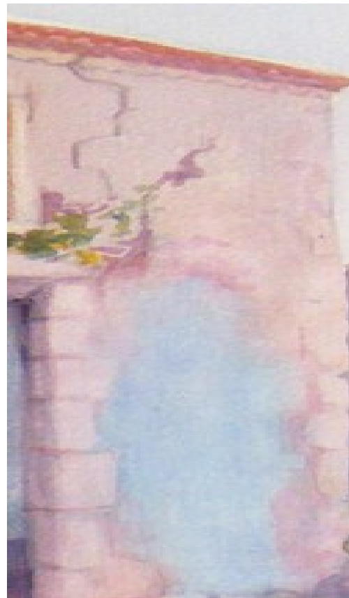
Illustration 8: Catherine Touzé©2020, tous droits réservés