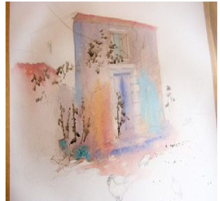
Illustration 4: Catherine Touzé©2020, tous droits réservés