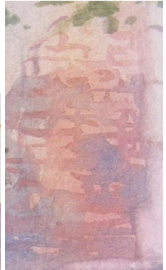
Illustration 7: Catherine Touzé©2020, tous droits réservés