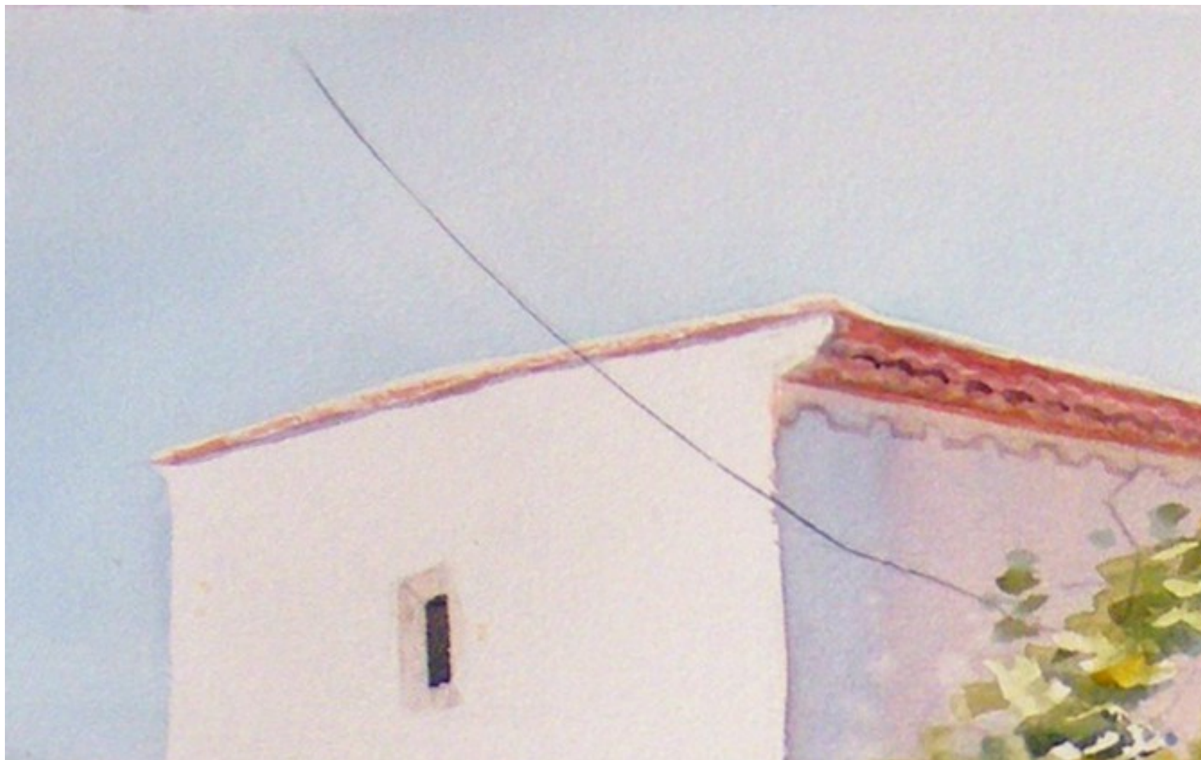
Illustration 17: Catherine Touzé©2020, tous droits réservés

*Raccordez au réseau et n'oubliez pas de nourrir les poules !