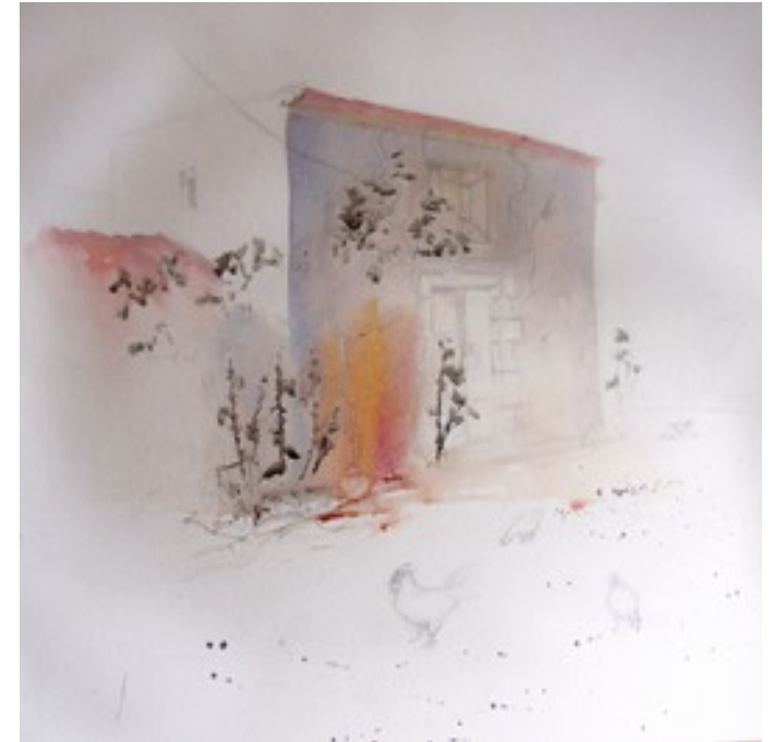
Illustration 3: Catherine Touzé©2020, tous droits réservés

*Une fois la façade sèche, poser les tuiles du toit.