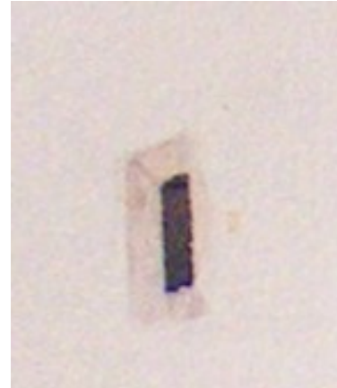
Illustration 10: Catherine Touzé©2020, tous droits réservés

* Fabriquer du très foncé avec le bleu winsor, le rose et le jaune auréolin.