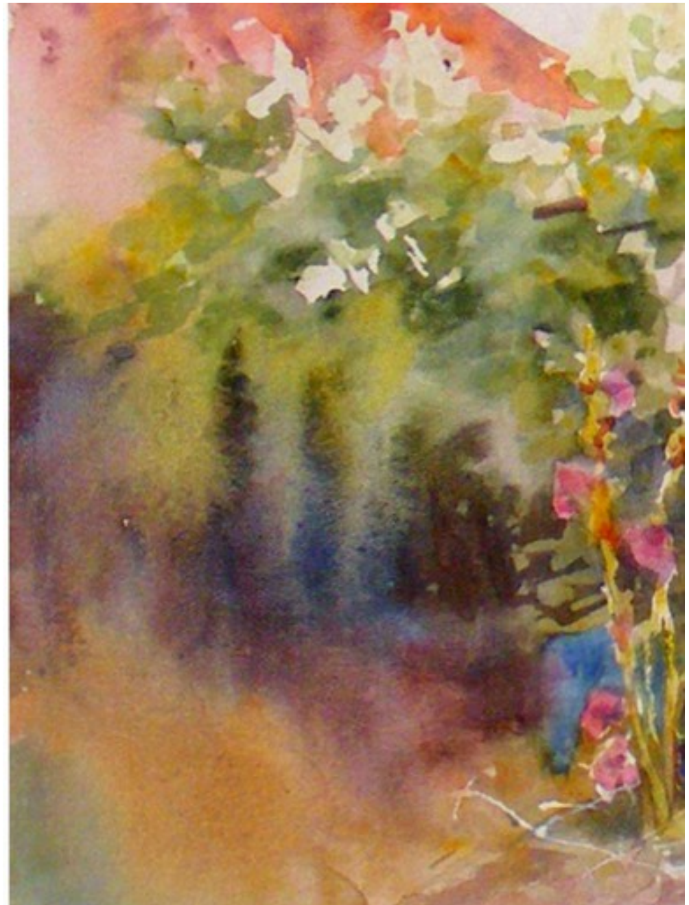
Illustration 12: Catherine Touzé©2020, tous droits réservés